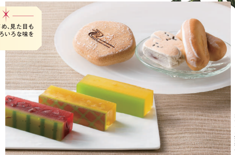
※イメージ写真です。