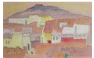
宇治山哲平《アスワンの民家》1965年

福田平八郎、高山辰雄、岩澤重夫、宇治山哲平、佐藤敬ら、大分県出身の代表的な画家たちが残した下絵やデッサン類に関連する本画とともに展示し、素描に秘められた躍動するイメージの魅力をひろく紹介する。