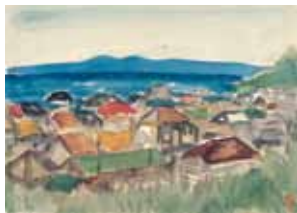
佐藤溪《海の見える家並》制作年不詳 聴潮閣蔵

一般 500(300)円 大学・高校生 300(100)円 ※( )内は20名以上の団体料金 ※中学生以下は無料 ※障がい者手帳等をご提示の方と その付添者(1名)は無料