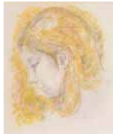
高山辰雄《少女》1978年頃

一般 300(250)円 ※( )内は20名以上の団体料金 大学・高校生 200(150)円 ※中学生以下は無料 ※障がい者手帳等をご提示の方と その付添者(1名)は無料