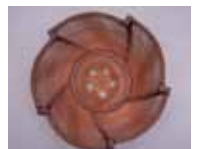
生野祥雲齋《時代竹籬盛心華賦》1943年